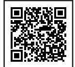
違反対象物公表制度